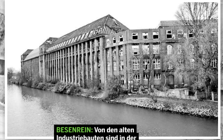
BESENEREIN: Von den alten Industriebauten sind in der Wasserstadt nur der alte Turm und einige Fabrik- und Verwaltungsgebäude geblieben.

Seit 1999 liegt die Wasserstadt Limmer brach. Die geplante Bebauung stockte lange. Nun möchte das Wohnungsunternehmen Gartenheim mit einer eigenen Ideenskizze eine neue Diskussion über mögliche Wohnformen anstoßen.