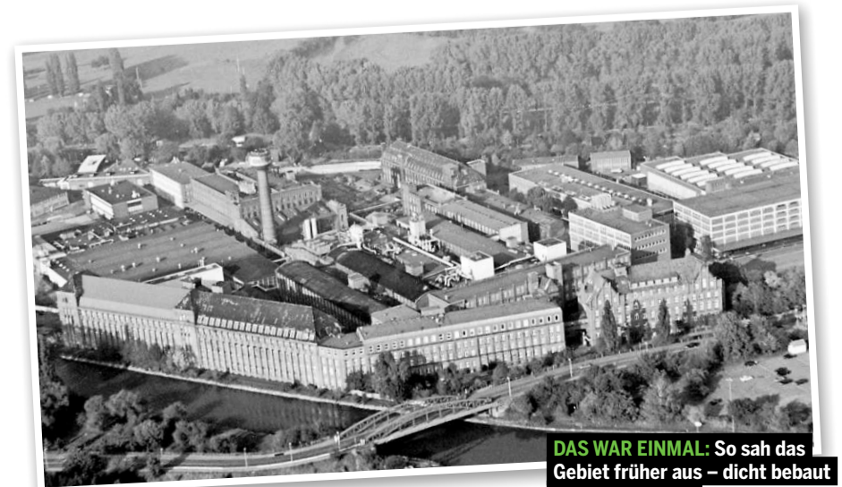
DAS WAR EINMAL: So sah das Gebiet früher aus – dicht bebaut mit Fabrikhallen.

und Altlasten-Sanierungsbetrieb Umweltschutz Nord. Doch letztere Firma ging 2004 in die Insolvenz, die Nileg stieg 2005 aus. Papenburg übernahm das Gelände schlussendlich allein. Im Jahr 2009 wurden die meisten der alten Produktionsgebäude gesprengt, anschließend trieb der Bauunternehmer die Sanierung des Bodens voran, die mittlerweile abgeschlossen ist. boh